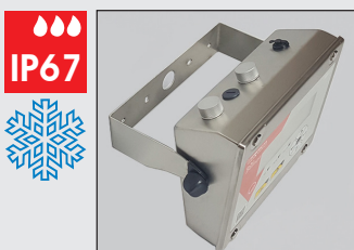
Support mural de série